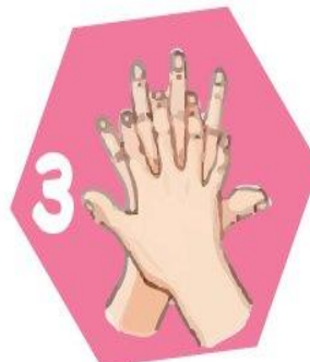
Не забываем про тыльную сторону рук