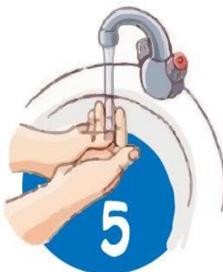
Споласкиваем руки теплой водой