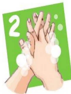
Промываем между пальцев