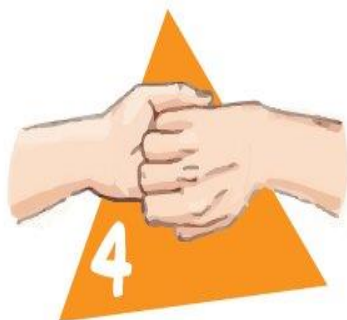
И про ногти